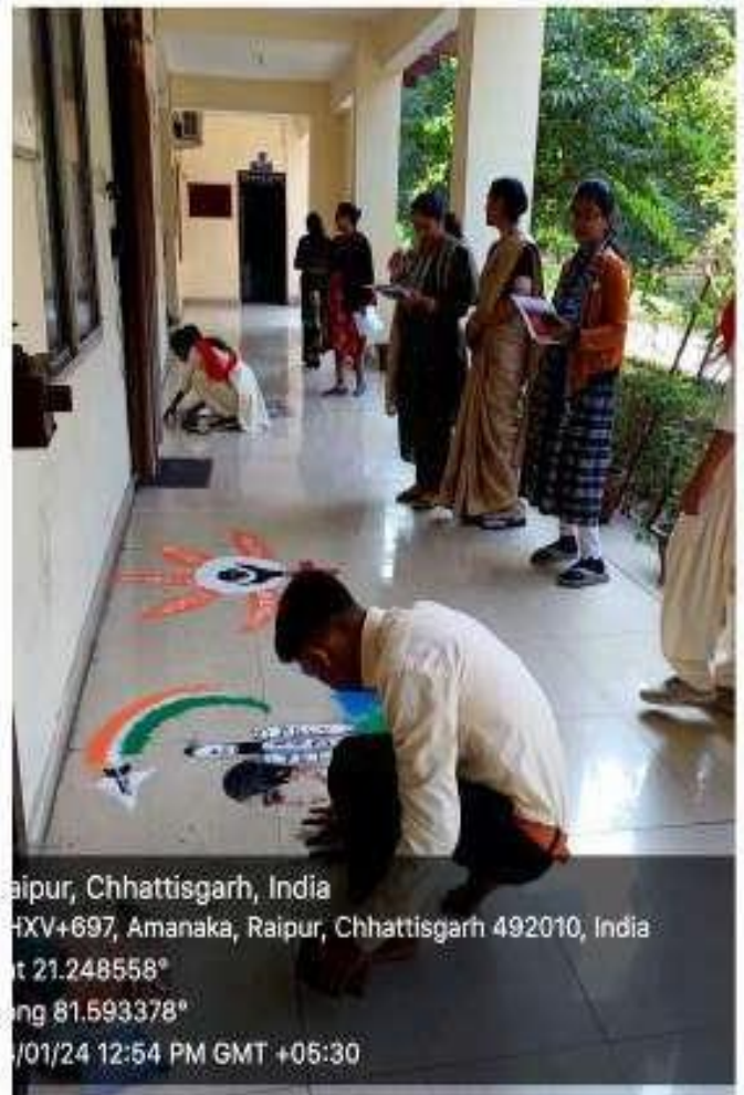
Raipur, Chhattisgarh, India XV+697, Amanaka, Raipur, Chhattisgarh 492010, India 21.248558° 81.593378° /01/24 12:54 PM GMT +05:30