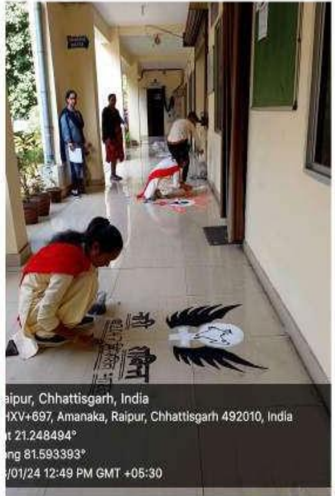
Raipur, Chhattisgarh, India XV+697, Amanaka, Raipur, Chhattisgarh 492010, India 21.248494° 81.593393° /01/24 12:49 PM GMT +05:30