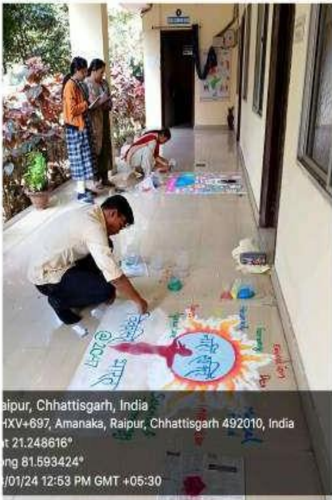
Raipur, Chhattisgarh, India XV+697, Amanaka, Raipur, Chhattisgarh 492010, India 21.248616° 81.593424° /01/24 12:53 PM GMT +05:30